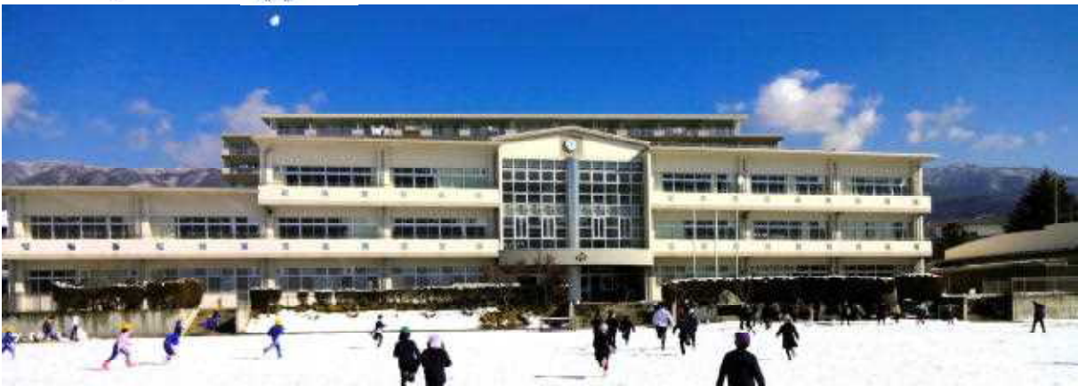
2/7(水) 降雪の翌日。青空の下、子どもたちの歓声が響き、元気に駆け回るの姿が見られました。