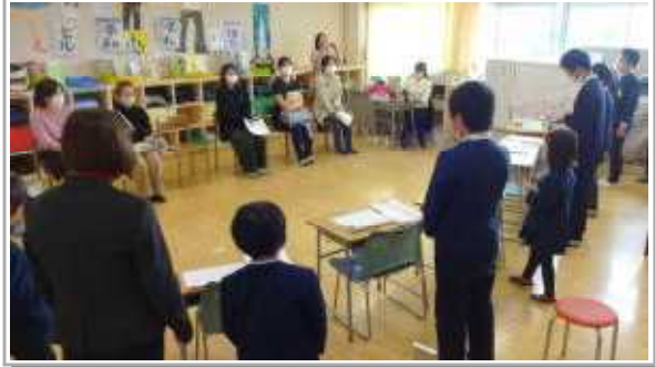
こだま123 自立活動「学習発表会」