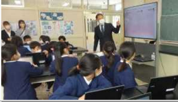
5学年 総合「安全なインターネットの使い方を考えよう」