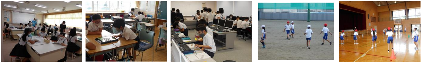
料理・手芸 囲碁・将棋・オセロ パソコン・イラスト 屋外 屋内

○ 6月14日（月）に、今年度、第1回目のクラブ活動が行われ、4～6年生が5つのクラブに分かれ、活動を開始しました。普段の授業ではできない内容もあり、また、たてわりで活動する貴重な機会です。年間5回実施予定です。楽しみながら活動してください。