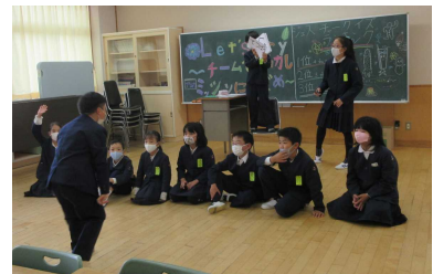
▲6班 Let's try !