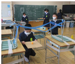
▲4班 競え!!バランスゲーム