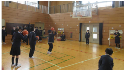
▲2班 コロナに打ち勝てボールフェス