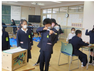
▲5班 高得点で一位を目指せ