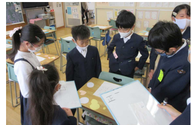
▲3班 みんなでスゴロク大会